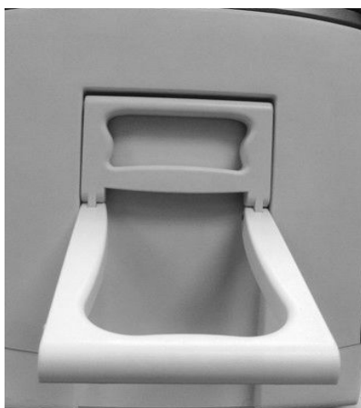
Poignée de transport